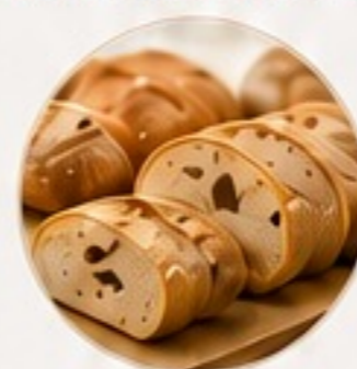
PANADERÍA Y PRODUCTOS HORNEADOS