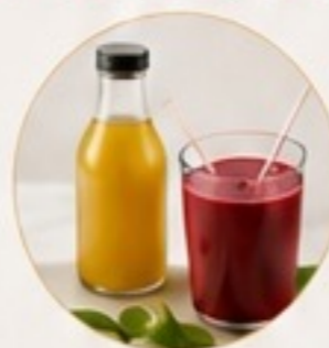
BEVERAGES AND SHAKES