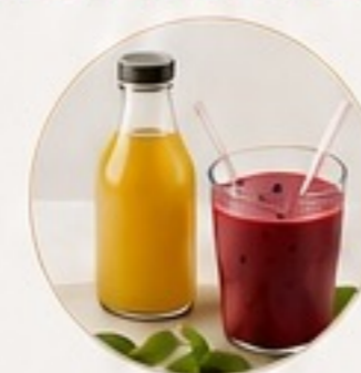
BEBIDAS Y BATIDOS