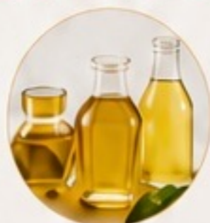
OILS AND LIPIDS