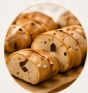
BAKERY AND OVEN-BAKED PRODUCTS