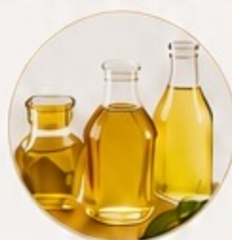
ACEITES Y LÍPIDOS