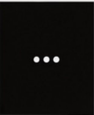
AND MANY MORE

*Please check current regulations in your country or territory.