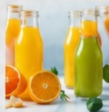
JUICES AND ALCOHOLIC BEVERAGES